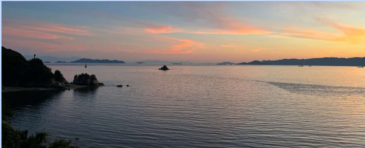
ドローンで撮影した写真です