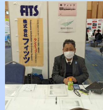
各イベントにも積極的に参加しています