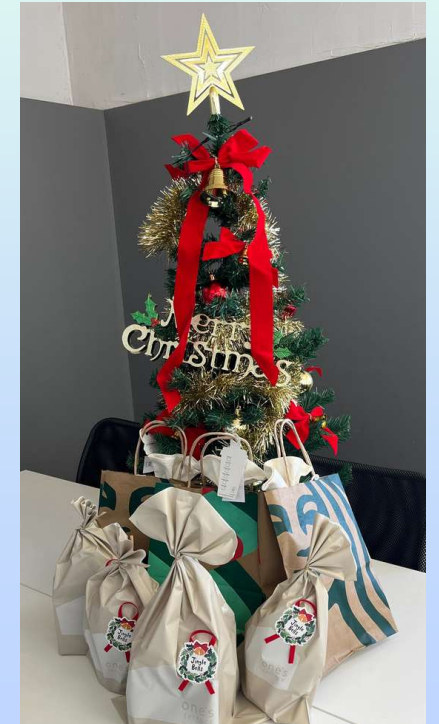
季節感のある行事を大切にしています