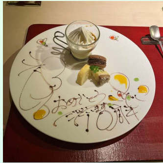
10周年記念で食事会を 開催しました