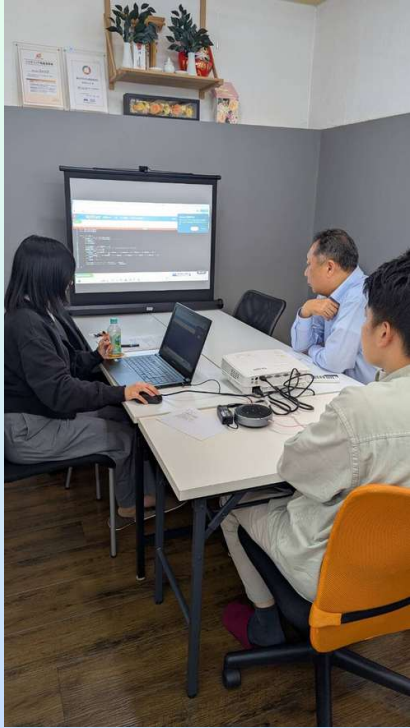
1DAY&5DAYSインターンシップも 随時受け付けています