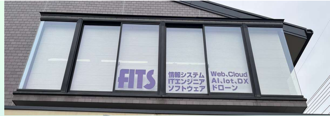
株式会社フィッツ外観